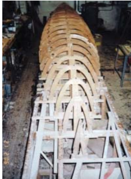
Skabelonerne, som bruges fra gang til gang, lines op og fastskrues på beddingen. I skabelonerne er der skåret ud til køl, essing og langrem.