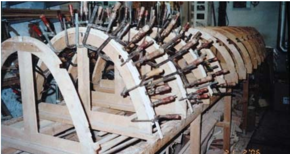
Spanterne fremstilles af asketræ fra Danmark. De limes sammen af mindst 3 lameller med epoxy lim og spændes over skabelonerne. Når alle spanter er limet, rettes de på siden og høvles i tykkelse.