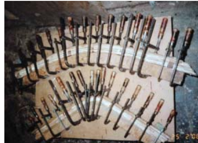
For og agterstævn limes af mange lameller over skabeloner og rettes til som spanterne. Materialet er en fin, fast mahogni, som hedder Araputanga eller Honduras mahogni. Den vokser fra Mellemamerika til midt ned i Brasilien ind mod Bolivia.

Essing køl og langrem fremstilles af grantræ. Arten hedder Silverspruce, og kommer fra det nordvestlige USA, hvor det vokser bag kystbjergene. Det bliver skåret af nogle store gamle træer, som har vokset langsomt i bjergene. Årringene er tætte, og der fås store lange stykker uden knaster. Alle træårer og mange master er fremstillet af Silverspruce, som er let og stærkt i lange stykker. Når træet vokser i Danmark hedder det Sitagran, men det er alt for løst i veddet og med mange knaster og kan ikke bruges til lette konstruktioner. Essingen samles af 3 stykker i længden og lægges ind i udskæringerne i skabelonerne, tilpasses og limes sammen med hinanden ved for- og agterstævn. Kølen limes også af 3 stykker og lægges ned i udskæringerne. Langremmen lægges i skabelonerne, afmærkes og tilhøvles så yderkanten passer efter skabelonerne.