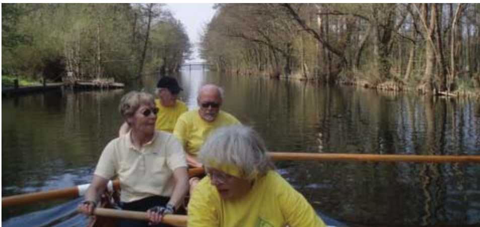
Forsidebilledet: Travlheden på en roaften.

Der gik et stykke tid før jeg var faldet til. Jeg kunne godt mærke at der var rigtig mange roere, der havde kendt hinanden i mange mange år. Sådan er det jo og det oplever man for det meste i alle foreninger. Men hvis man bliver ved med at troppe op, bliver man helt sikkert accepteret før eller senere.