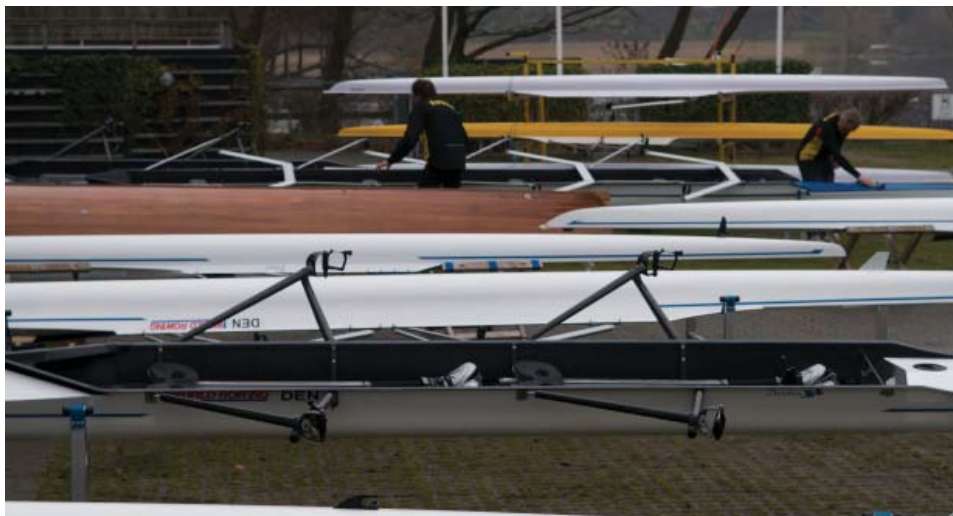
Aktive roere. Forpladsen en lørdag i januar

Furesøen om vinteren føles som om den er gået i hi, når vi sammenligner med sommerens milde, lyse og solrige roning. Alligevel er det en dejlig oplevelse. Enkelte svaner og et års