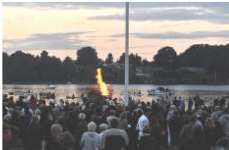
Så er bålet tændt

Det var en rigtig hyggelig aften i selskab med glade roere, påhæng, Rubber Band og Mads Westfall.