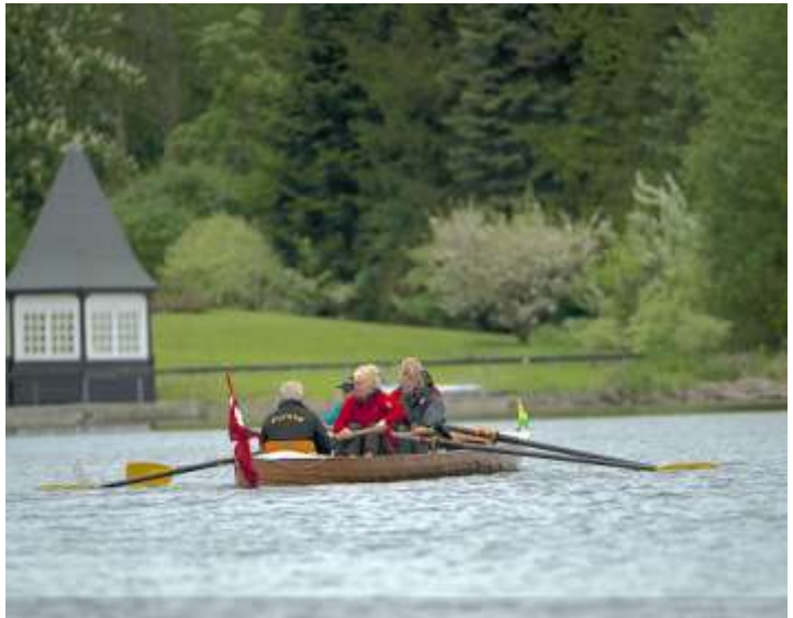
Roskole 2013

Turen til Vejlesø mindede mig også om, at det faktisk er umådelig vigtigt, at vi satser på fællesskab på mandags- og onsdagsaftenerne, og at vi sammen ror både til Vejlesø og søen rundt, så nye og gamle bliver godt blandet. Det samme gælder outrigger- og inriggerlisterne, vi må sørge for ikke at få delt os op i for mange "underklubber".