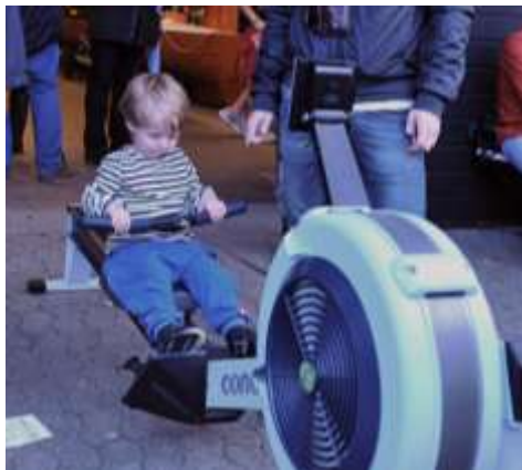
Et nyt medlem?

Efter en regnbyge kom solen, og en flot regnbue prydede himlen. Der blev grilllet bøffer og pølser, børnene kæmpede i 2 opstillede ergometre, klovnene blæste balloner, og heksen blev sendt til Bloksbjerg.