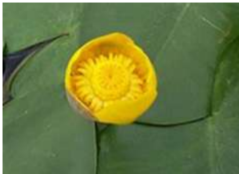
-Åkande har gule blomster-