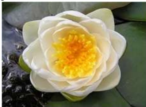
-Nøkkerose har hvide eller røde blomster-